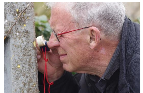
Les lichens, un monde qui s'observe à la loupe.

L'après-midi, une promenade dans le bourg de Sainte-Maure était prévue pour montrer les lichens dans leur milieu. Plusieurs lichens corticoles, saxicoles et terricoles ont pu être observés sur les arbres, les pierres et sur le sol.