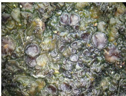
Thalle gélatineux d' Enchylimum tenax