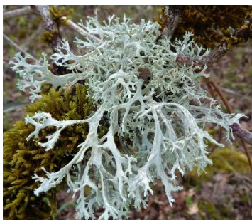
Thalle fruticuleux d' Evernia prunastri