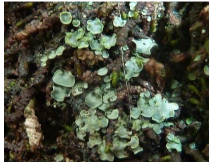
Thalle squamuleux de Normandina pulchella