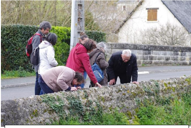
Lichens saxicoles sur un muret près du lavoir.