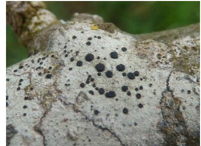
Thalle crustacé de Lecidella elaeochroma