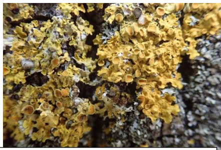
Thalle foliacé de Xanthoria parietina